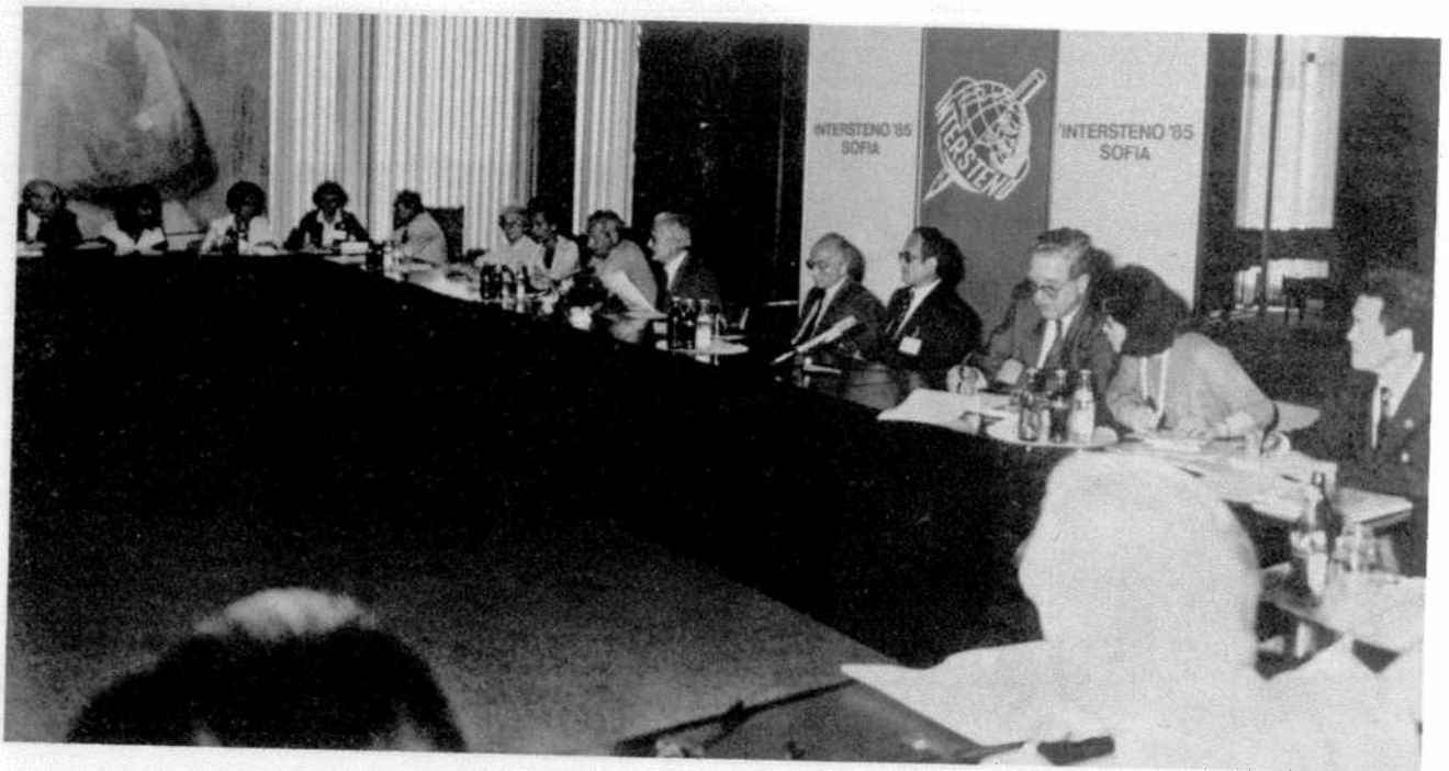
Sitzung der Jury Stenographie.